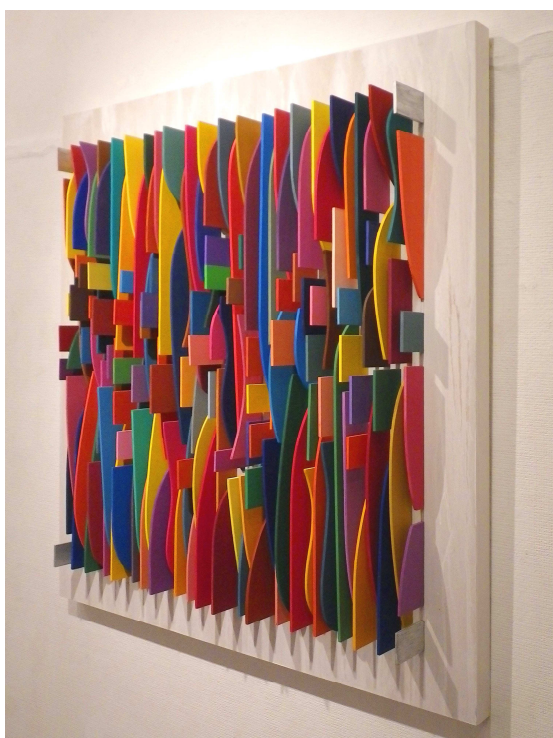
【左】 ウッドチップの色彩立体